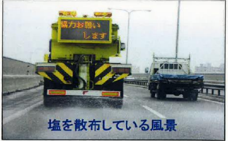
塩を散布している風景