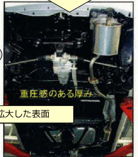
重圧感のある厚み

⚠️ 施工価格は、車種によって変わります。詳しくは営業スタッフまでご確認ください。